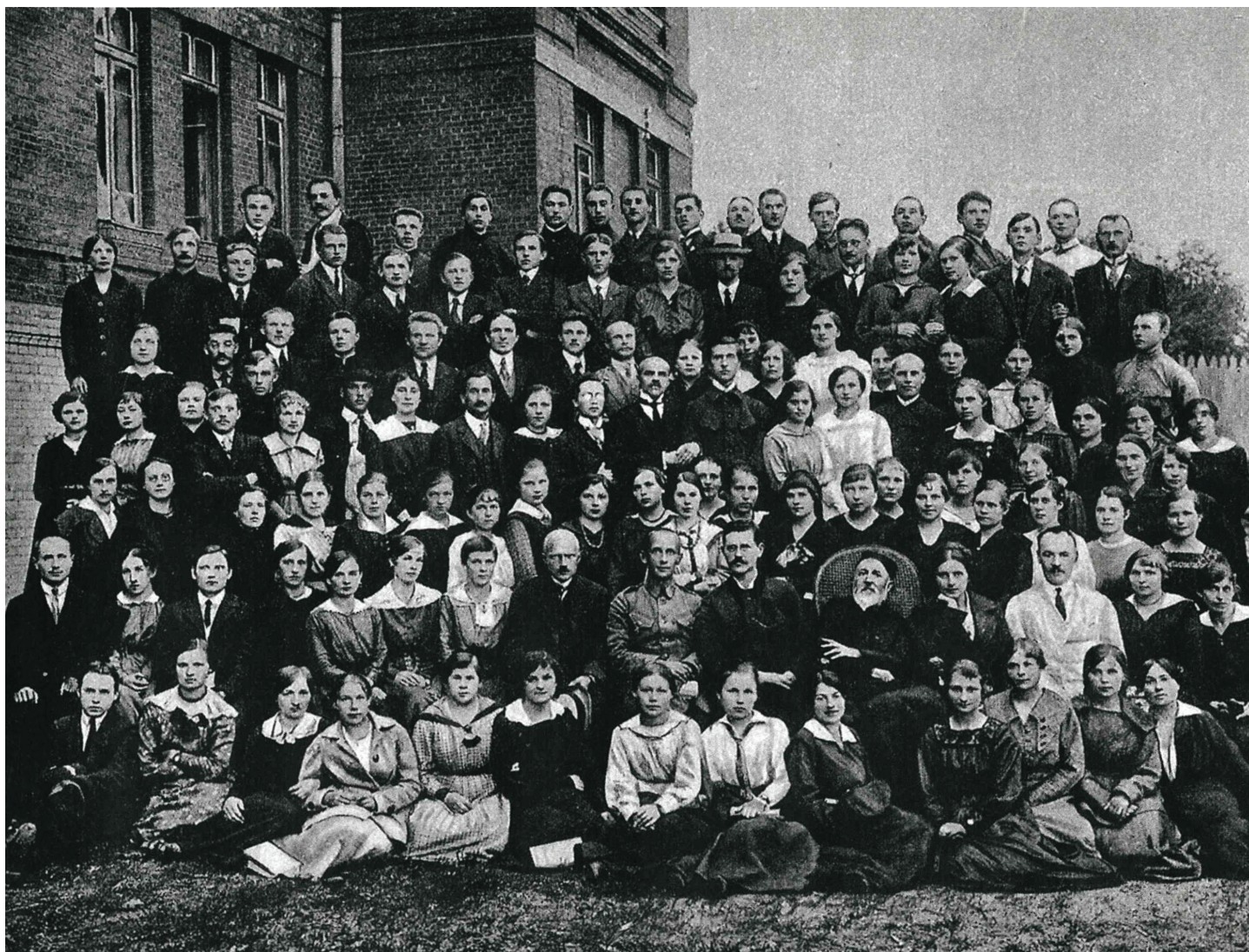
Pirmojo Lietuvos agronomų suvažiavimo nariai Kaunas. 1919 m.