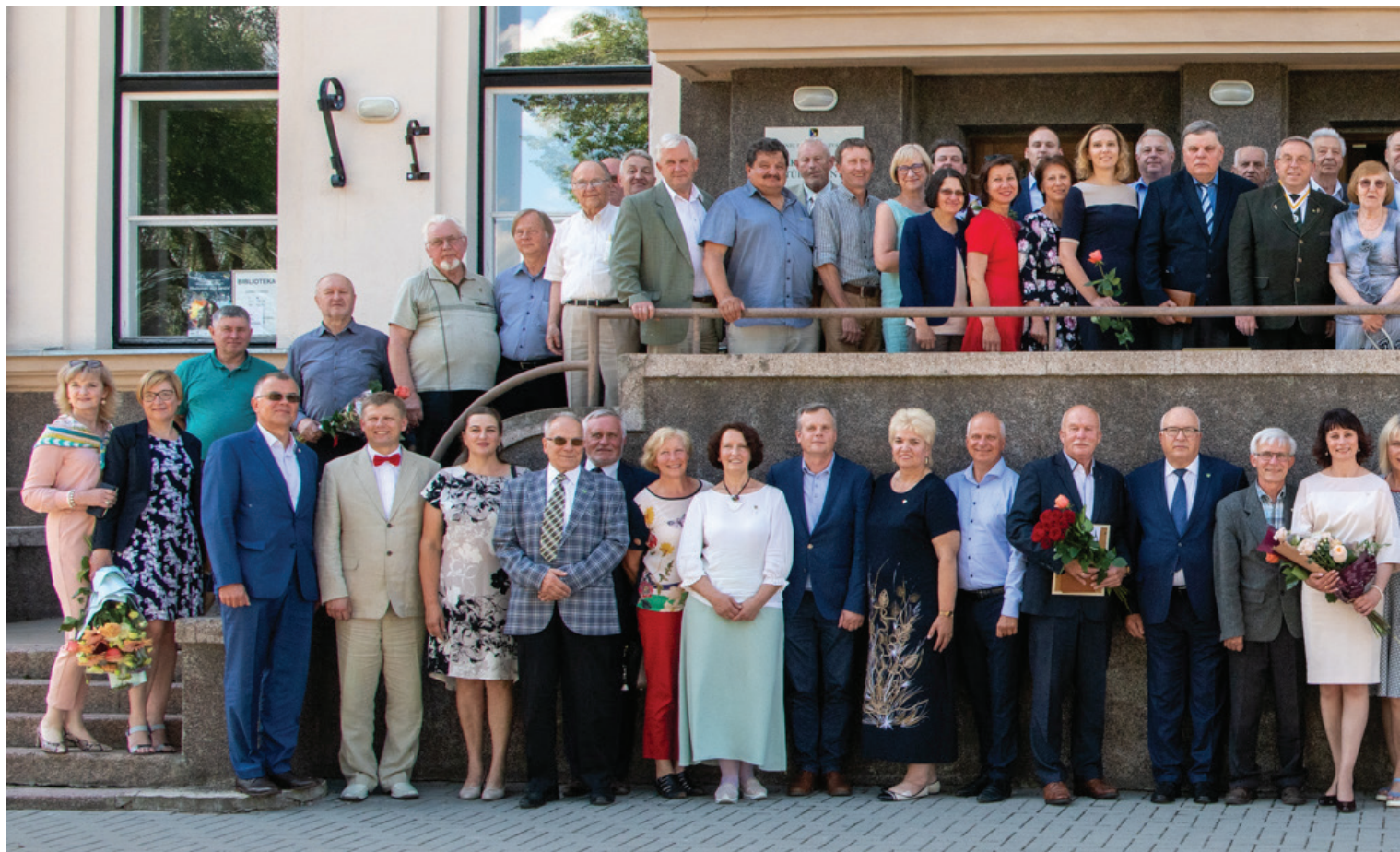
XXXIII LAS suvažiavimas, 2020 m.