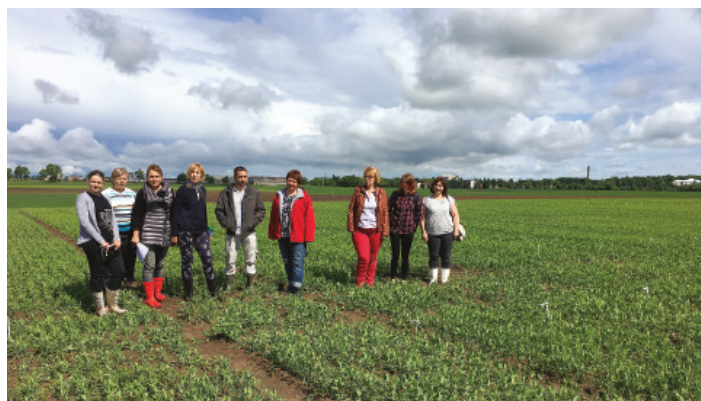
LAMMC skyriaus agronomės prie eksperimentų laukelių.