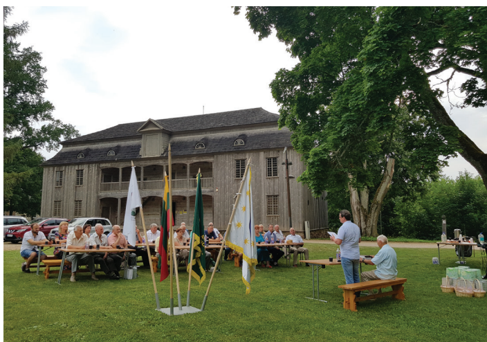
Šventinio renginio akimirka

Lietuvos agronomų sąjungos (LAS) Šiaulių r. skyriaus agronomai susirinko Kurtuvėnų regioniniame parke paminėti Lietuvos agronomų sąjungos 100-metį ir Agronomų dieną.