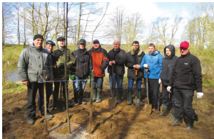
Šakių agronomai pasodino agronomų ąžuolyną.