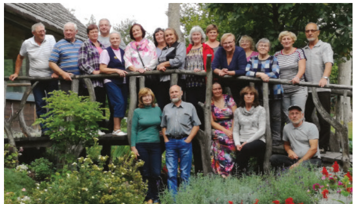
Šventiškai nusiteikę visų kartų Varėnos skyriaus agronomai.