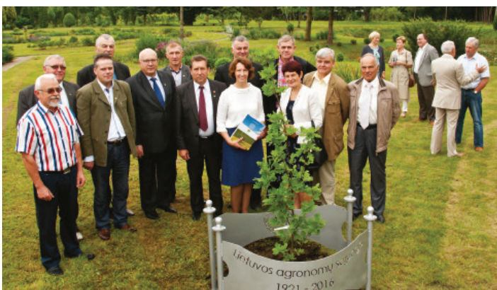
Šilutės ir Šilalės r. agronomai LAS XXX suvažiavime.