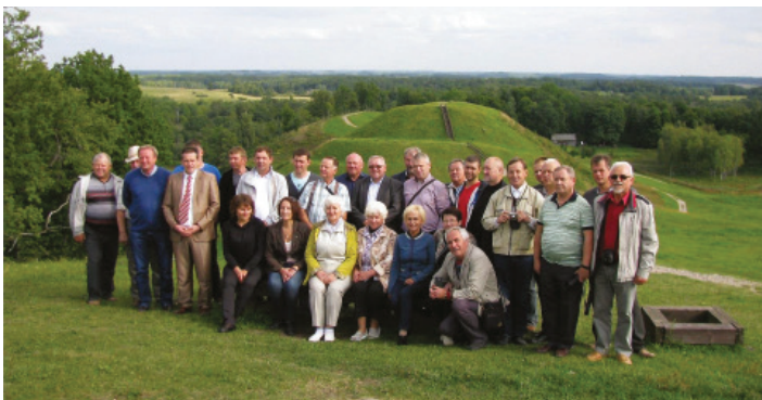
Pas Šilalės r. kolegas viešėjo LAS Šakių r. skyriaus agronomai.