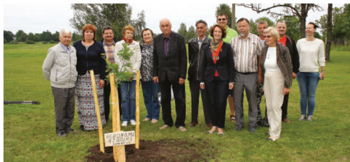
Kupiškio r. skyriaus agronomai su bičiuliais iš Rokiškio, Biržų, Šilutės r. vieši Topolio parke, prie Agronomų ąžuolo.