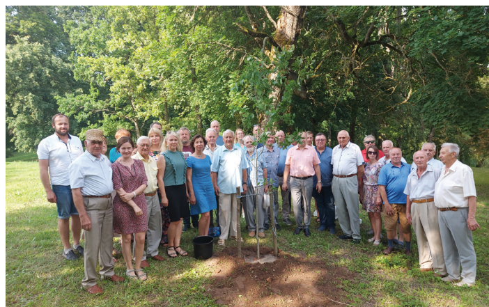
Agronomai prie pasodinto ąžuolo

Šiaulių r. agronomus daugiau kaip dešimtmetį sieja graži draugystė su Kurtuvėnų regioniniu parku, kuriam vadovauja Rimvydas Tamulaitis. Agronomai puoselėja tradiciją parke pasodinti medelių – ąžuolų, kedrų ir kitų rūšių medžių. LAS 100-mečio proga parke pasodintas ąžuolas.