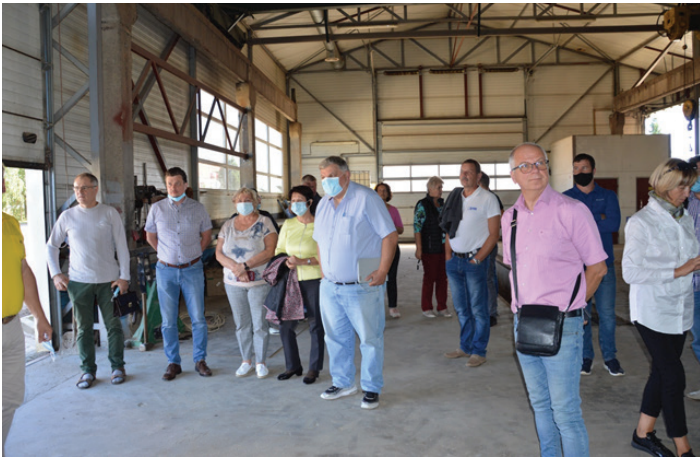
Valdybos nariai Lašų žemės ūkio bendrovėje.

Valdybos nariai susipažino su Lašų žemės ūkio bendrovės veikla, apžiūrėjo gamybinį potencialą, ragavo Lašų duonos gaminius.