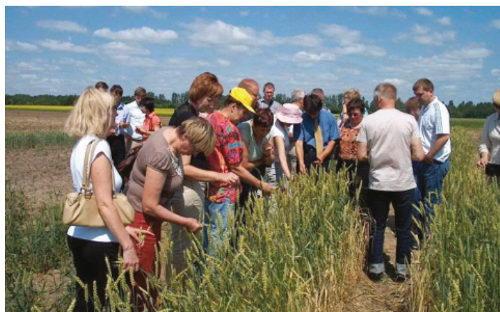
Valstybinės augalininkystės tarnybos organizuoti oficialiųjų aprobuotojų mokymai.