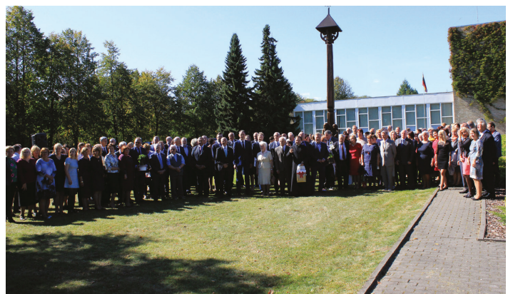
Sodininkystės daržininkystės institutas švenčia 80 metų jubiliejų.